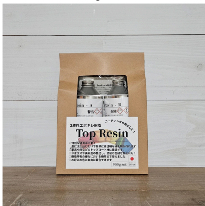
【パッケージ品】900gセット