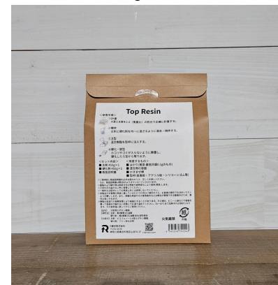
【パッケージ品】900gセット - 裏面